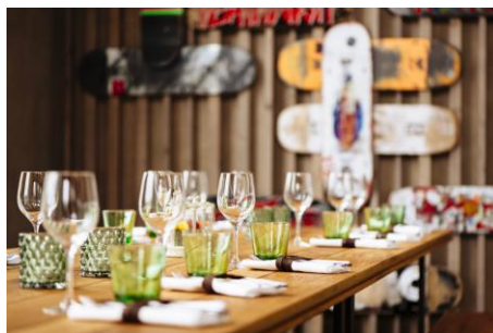
Wystroj wnętrza restauracji Mavericks łączy naturalne materiały z elementami surferskimi. Na zdjęciu: Mavericks Berlin