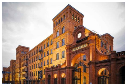
Vienna House Andel's Lodz w gronie finalistów Profit Hotel Awards 2019 w kategorii „Hotel / Obiekt historyczny / zabytkowy” oraz „Nowatorska strategia marketingowa”.