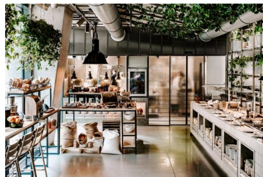
Vienna House Mokotow Warsaw w gronie finalistów Profit Hotel Awards 2019 w kategorii „Nowy Hotel / Obiekt” oraz „Najlepszy Wystrój / Design”.