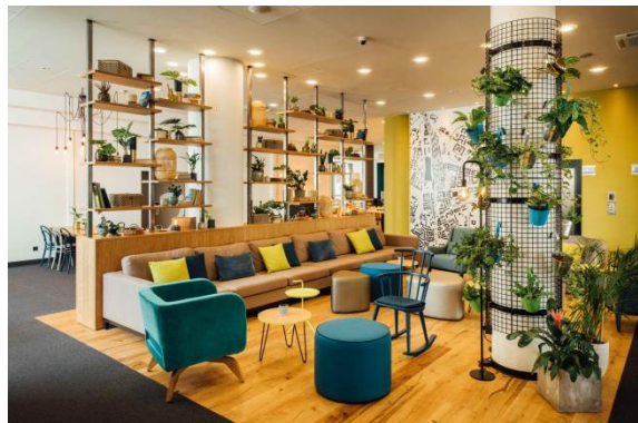
Lobby to serce hotelu. Wystrój wnętrza Vienna House Easy Cracow nabrał świeżości i lekkości.