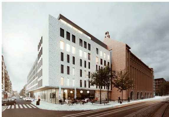
Vienna House Easy Wrocław jest zlokalizowany w centrum miasta, w zabytkowym budynku Starej Piekarni.