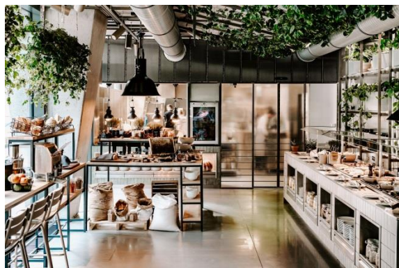
Restauracja Greenhouse w Vienna House Mokotów Warsaw jest zieloną oazą w biznesowej dzielnicy.