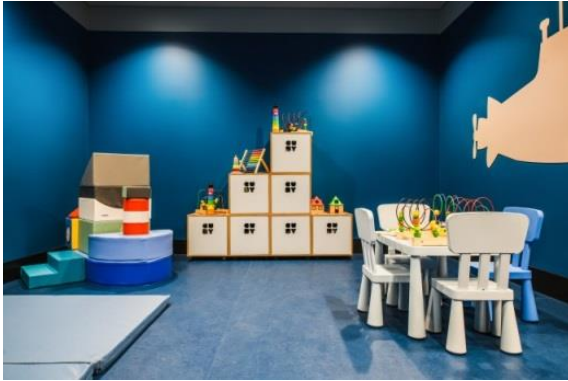
Sala przygód Captain Nemo to przystań dla dzieci w chłodniejsze dni.