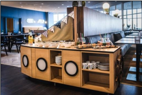
Bufet śniadaniowy przypominający statek oferuje wiele świeżych morskich specjałów oraz dań dla najmłodszych.