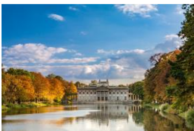
Warszawa jest jedną z najbardziej zielonych stolic w Europie. Łazienki Królewskie.