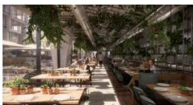
Restauracja Greenhouse ze szklanym tarasem w stylu śródziemnomorskiego placu oferuje dania ze świeżych produktów z rynku. RENDERING © Vienna House