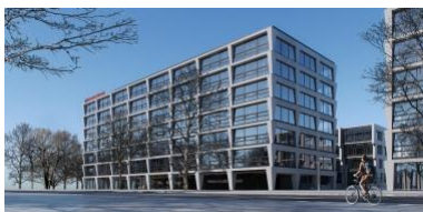
Vienna House Mokotow Warsaw znajduje się 10 minut drogi od Lotniska Chopina i 20 minut drogi od centrum Warszawy. Otwarcie: luty 2019. Wizualizacja © Vienna House

Zdjęcia w wysokiej rozdzielczości do pobrania: www.viennahouse.com